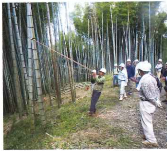
森林ボランティアリーダー研修会(竹林整備)