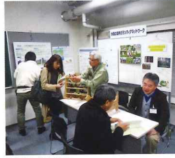
活動報告会・交流会

す。受講者は、下刈りや間伐等基本的な森林整備の必要性や方法等について学ぶほか、実際に体験も行い、午後は木工クラフトや薪割体験等も楽しむなど木の良さに触れる時間もあります。