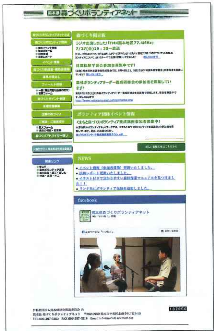
熊本県森づくりボランティアネットWebサイト www.midori-no-mori.net/

ボランティアネットの主な活動を紹介します。 ウェブサイトを作成して情報の収集・発信を行い、団体からの相談への対応や現地での指導も行います。 また、県民やボランティア初心者向けの研修会を開催していま