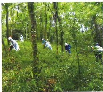
初心者研修会(下刈り)