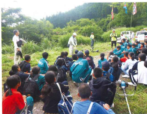
ボランティア活動アドバイザー現地指導